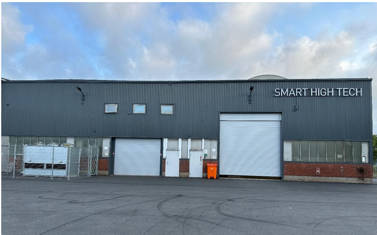
Fabriken på Arendals Allé, Hisingen, Göteborg